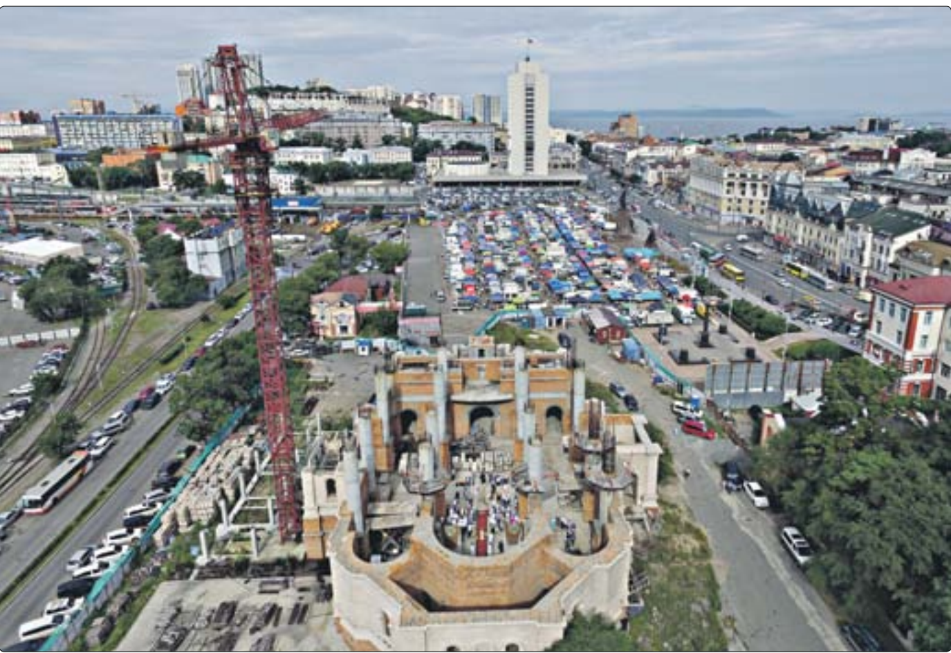
Панорама. Молебен в строящемся храме. Август 2016 г.