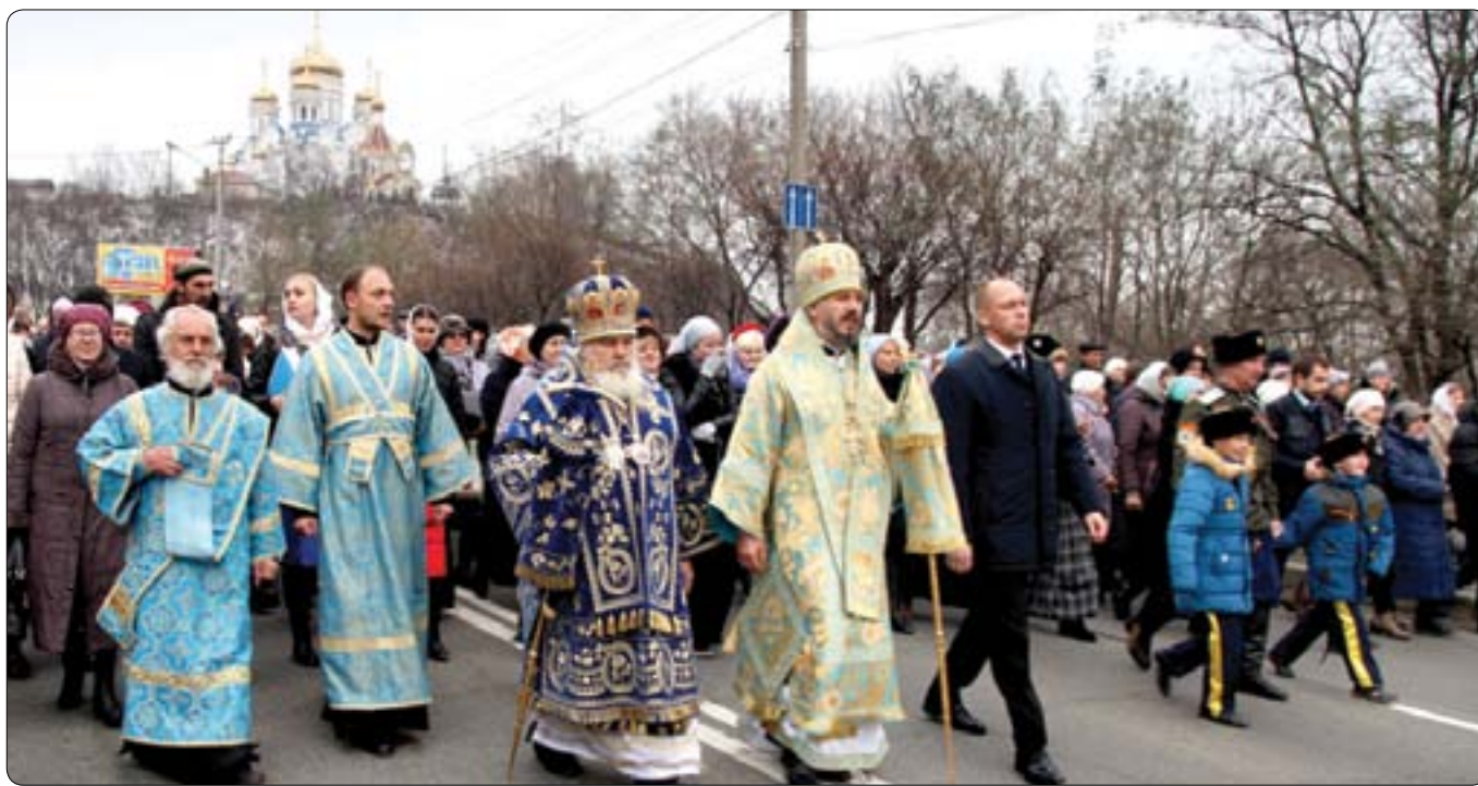
Крестный ход в Находке в честь праздника Казанской иконы Божией Матери и Дня народного единства

Вот уже несколько лет как в России возобновилось празднование 4 ноября в честь Казанской иконы Богородицы, Дня народного единства. Этот отрадный факт внушает надежду, что мы, современники, восстанавливаем духовную связь времен, единение с нашими благочестивыми предками, с христианскими традициями и ценностями.