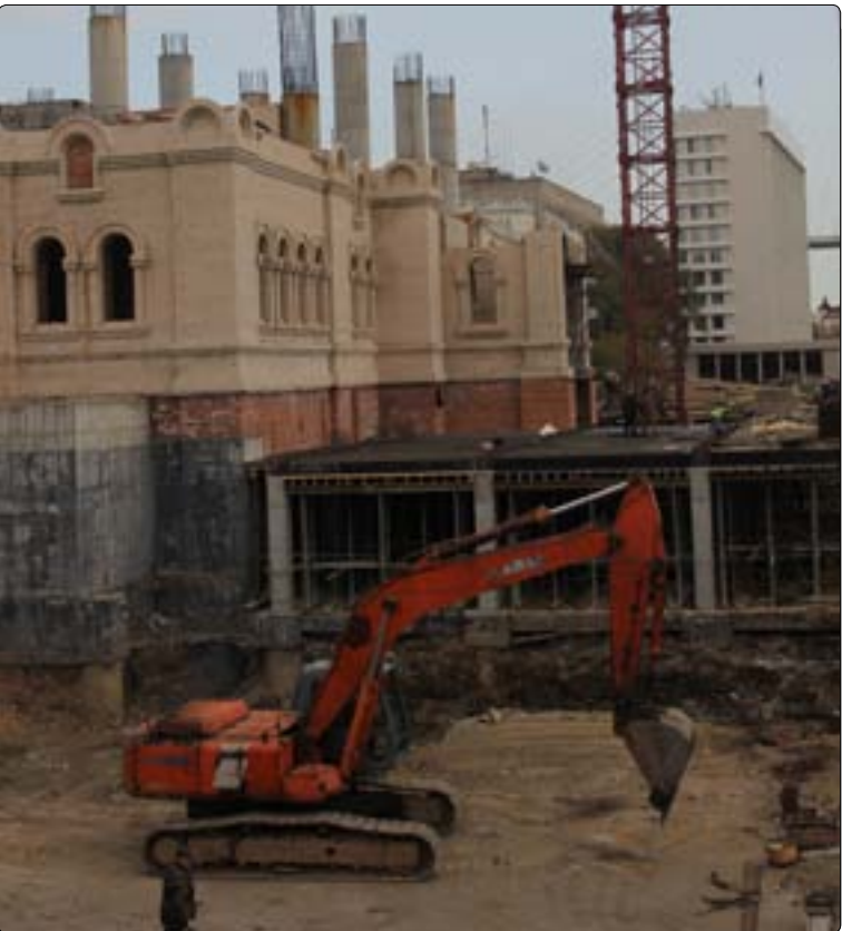
Осенью возобновились работы. На строительную площадку зашла спецтехника.

Федорин. — 400 тыс. руб. было выделено на приобретение церковной утвари, богослужебных предметов, облачений; 300 тыс. — на установку купола; на частичную оплату проекта собора выделено 600 тыс. рублей. Основание временного храма стало важнейшим этапом строительства, поскольку молитва, — отмечает священник, — это, по сути, самая важная помощь в деле! Приглашаем всех на богослужения во временную Преображенскую церковь. Расписание служб можно узнать на сайте Владивостокской епархии vladivostok-eparchy.ru и на сайте Спасо-Преображенского собора vl-preobrazhtnie.ru