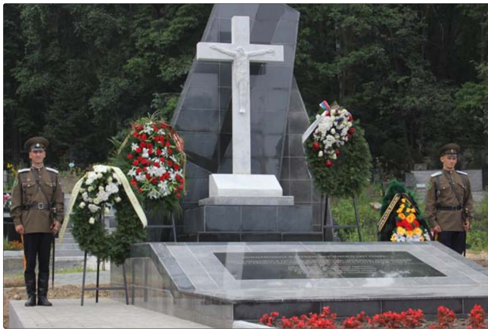
Мемориальный комплекс памяти жертв репрессий на Лесном кладбище