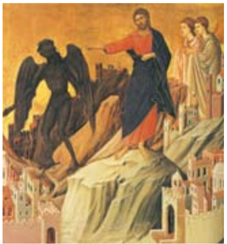
Искушение Христа на горе. Дуччо ди Буонисенья. 1308–1311

Интересно, что под «злым» или «лукавым» в молитве Господней можно понимать как дьявола, так и зло как таковое. И в этом нет никакого противоречия или неясности. Дело в том, что христианство — это религия личности. Богу как Личности, единственному источнику добра и бытия, противопоставит личность — дьявол.