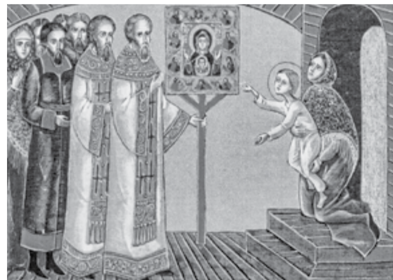
Чудесное исцеление отрока Серафима Саровского

— Матушка, родимая моя, почто ты так горько плачешь? Зачем убиваешься обо мне? Не ты ли меня учила, что Бог не оставляет сирот, и уповающий на Господа не погибнет? Слышал я, родная, как лекарь тебе говорил, помру я. Да ведь