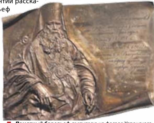
■ Памятный барельеф святителю на фасаде Успенского храма

Настоятель Успенского храма владыка Иннокентий рассказал, что барельеф из бронзы был изготовлен в Москве, по эскизу скульптора Алексея Селиванова, с памятной надписью: «Святитель Иннокентий Вениаминов, видный иерарх, миссионер и участник присоединения Приамурья к России в XIX веке».